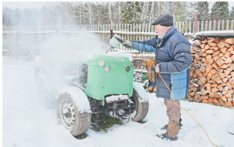
Ручной «фен» сдувает с трактора снежок

Потом армия, железнодорожные войска. Строили дорогу Абакан – Тайшет. Это была первая дорога в СССР, электрифицированная